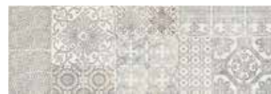
303560/46 99 ■ Vinci Mix Decoro Satinato 25x75 10"x30"