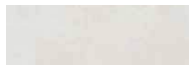
303556/41 85 ■ Vinci Pearl Satinato 25x75 10"x30"