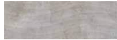
303546/46 99 ■ Harmony Grey Wave Lucido 25x75 10"x30"