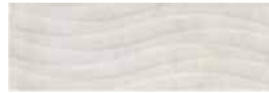
303547/46 99 ■ Harmony Pearl Wave Lucido 25x75 10"x30"