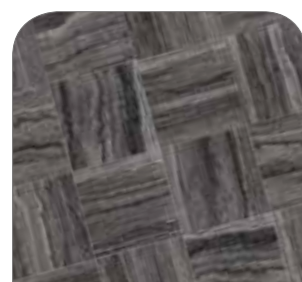
Memento Travertino Black

GRES PORCELLANATO • PORCELAIN STONEWARE PAVIMENTI CONSIGLIATI • RECOMMENDED FLOORING