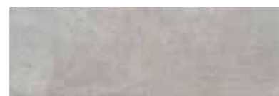
303558/41 85 ■ Vinci Grey Satinato 25x75 10"x30"