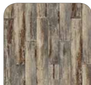
Mama Wood Old Teak