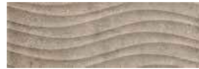
303554/46 99 ■ Soho Dark Onda Satinato 25x75 10"x30"