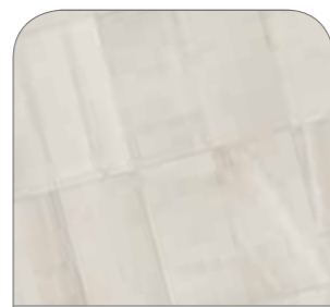
Stone Collection White