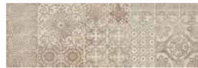
303552/46 99 ■ Soho Mix Decoro Satinato 25x75 10"x30"