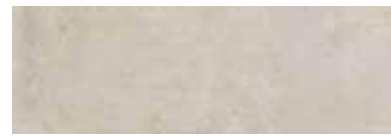
303550/41 85 ■ Soho Light Satinato 25x75 10"x30"