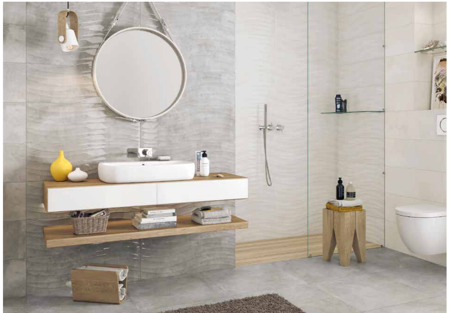
HARMONY PEARL LUCIDO 25X75, HARMONY PEARL WAVE LUCIDO 25X75, HARMONY GREY WAVE LUCIDO 25X75 PAVIMENTO EMOTION GRIS 60X60

GRES PORCELLANATO • PORCELAIN STONEWARE PAVIMENTI CONSIGLIATI • RECOMMENDED FLOORING