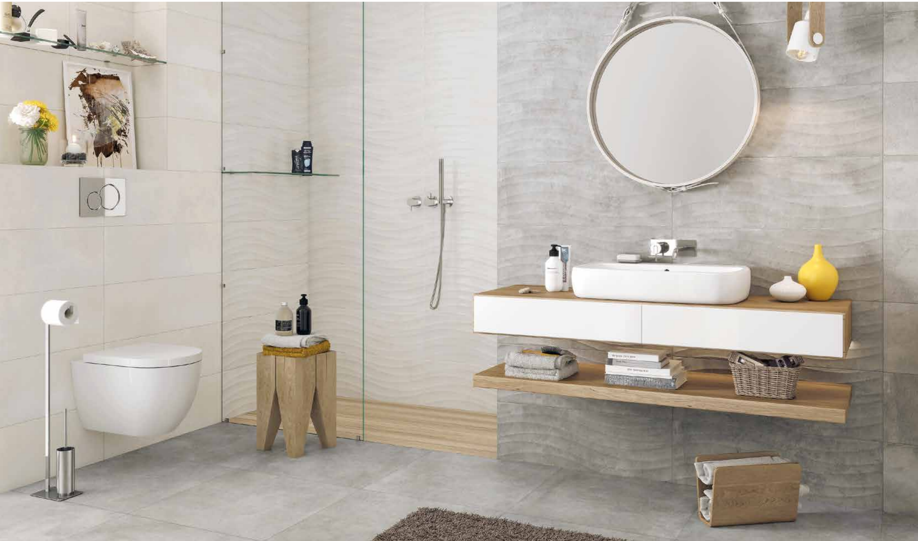
VINCI PEARL SATINATO 25X75, VINCI PEARL ONDA SATINATO 25X75, VINCI GREY ONDA SATINATO 25X75