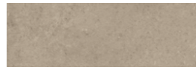
303551/41 85 ■ Soho Dark Satinato 25x75 10"x30"