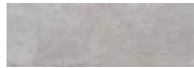
303545/41 85 ■ Harmony Grey Lucido 25x75 10"x30"