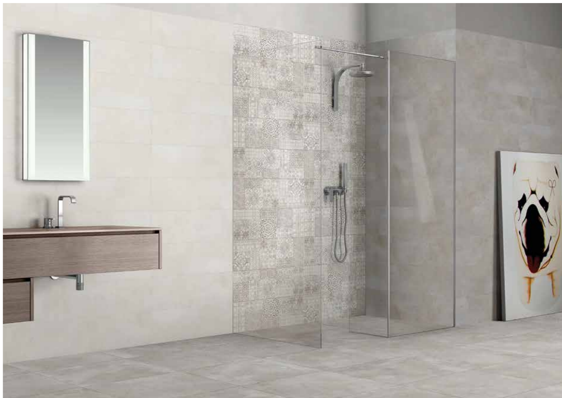
VINCI PEARL SATINATO 25X75, VINCI GREY SATINATO 25X75, VINCI MIX DECORO SATINATO 25X75 PAVIMENTO EMOTION GRIS 60X60

GRES PORCELLANATO • PORCELAIN STONEWARE PAVIMENTI CONSIGLIATI • RECOMMENDED FLOORING