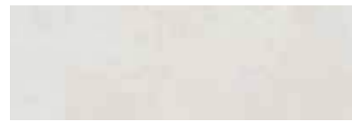
303544/41 85 ■ Harmony Pearl Lucido 25x75 10"x30"