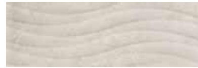
303553/46 99 ■ Soho Light Onda Satinato 25x75 10"x30"